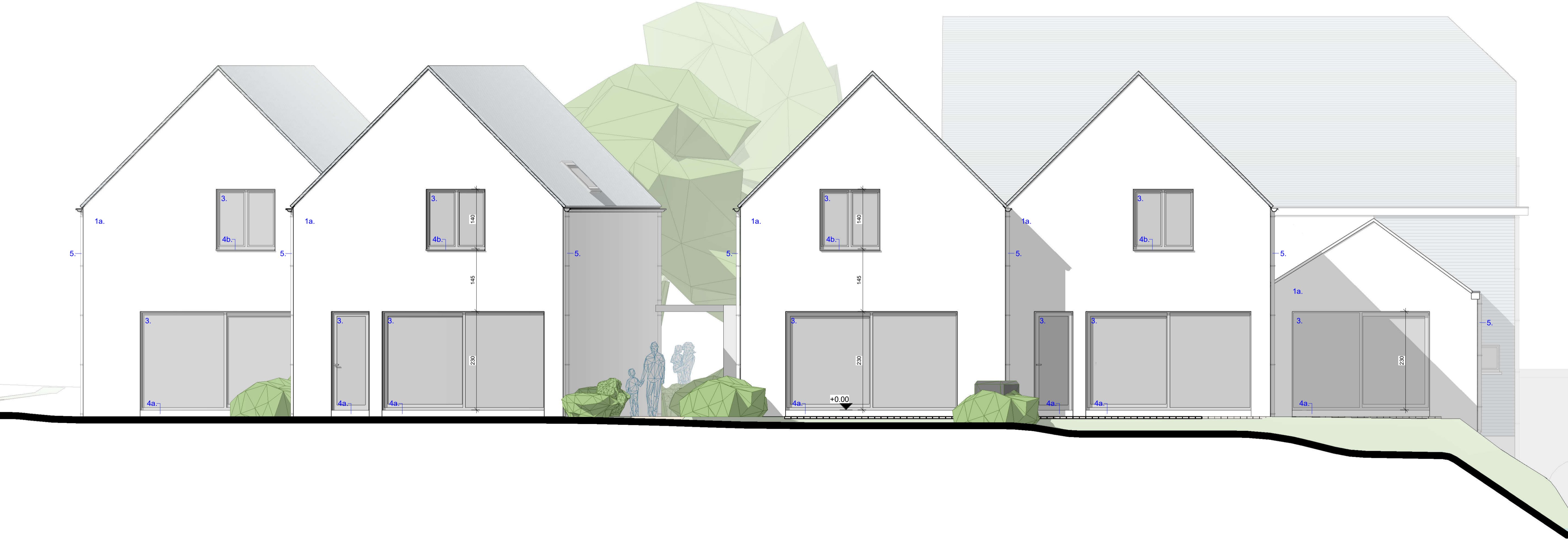
3 Achtergevel 1 : 50