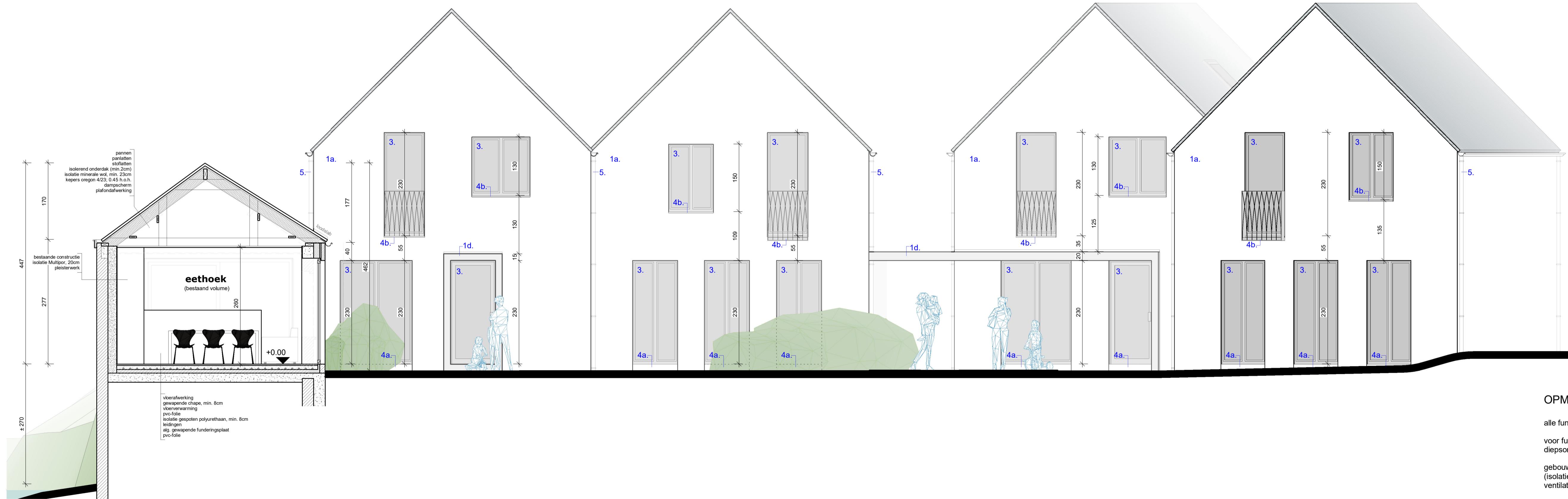
3 Doorsnede CC' 1 : 50