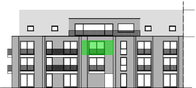
ACHTERGEVEL - W