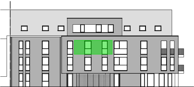
VOORGEVEL - O