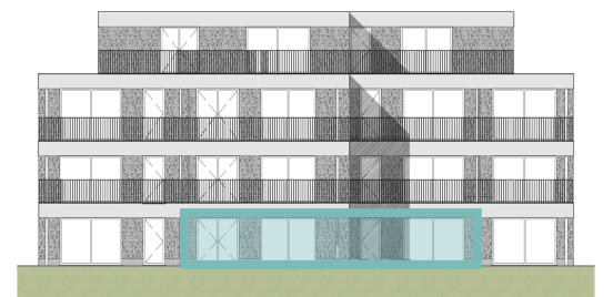
Achtergevel Blok B