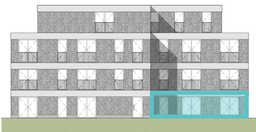
Voorgevel Blok B