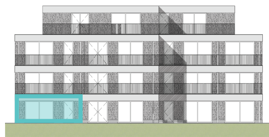
Achtergevel Blok B