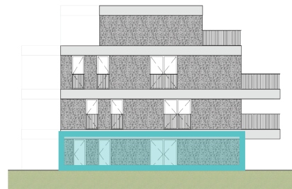
Rechtergevel Blok B