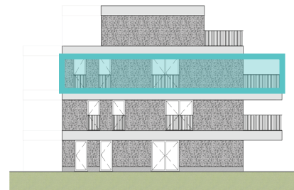
Rechtergevel Blok B