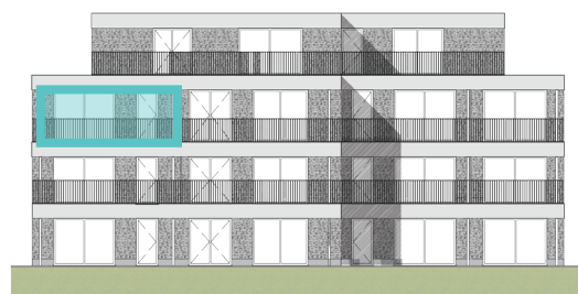
Achtergevel Blok B