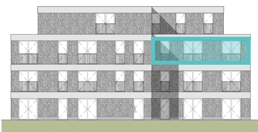
Voorgevel Blok B