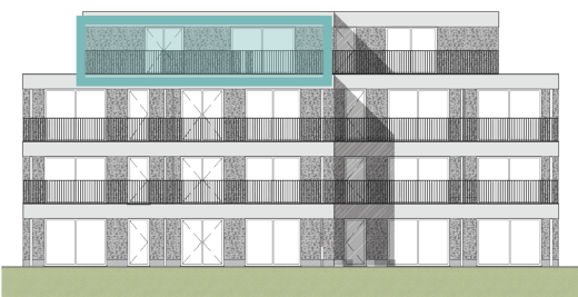
Achtergevel Blok B