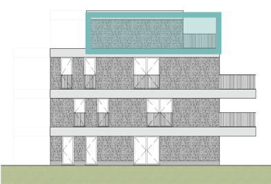
Rechtergevel Blok B