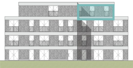
Voorgevel Blok B