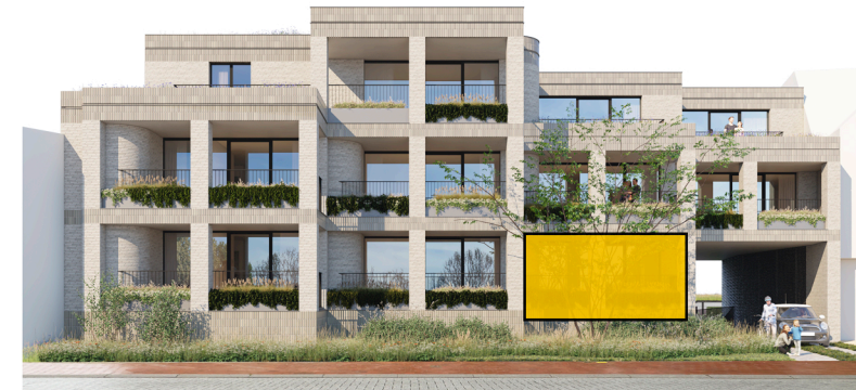
VOORGEVEL Camille Van der Cruyssenstraat