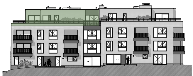
Façade rue / Straatgevel