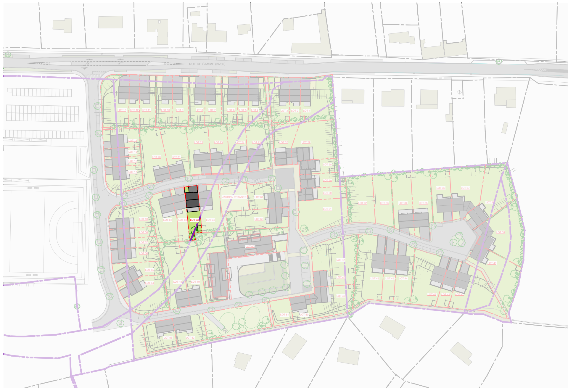
PLAN DE LOTISSEMENT