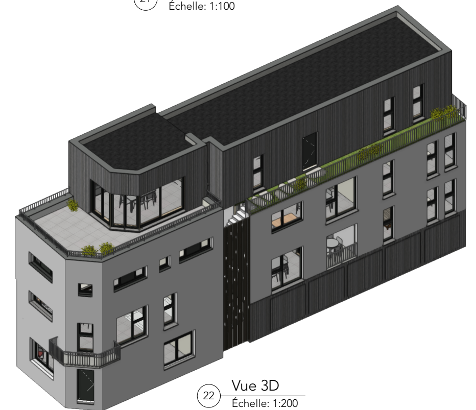
22 Vue 3D Échelle: 1:200