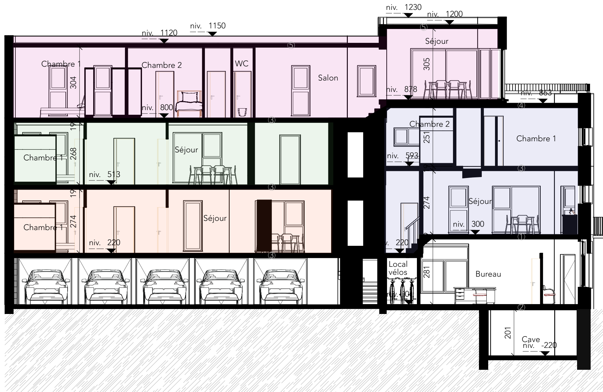
20 Coupe AA Échelle: 1:100