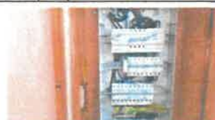
Tableau 1 : 11 1xDDR300(4P)/1xDDR30(4P)/1x25A(4P) 1x20A(4P)/6x16A(2P)/1x4A(2P) Tableau 2 : 9 1xDDR30(4P)/6x20A(2P)/2x16A(2P)

Mise à la Terre de l'installation : Piquets / barres de Terre