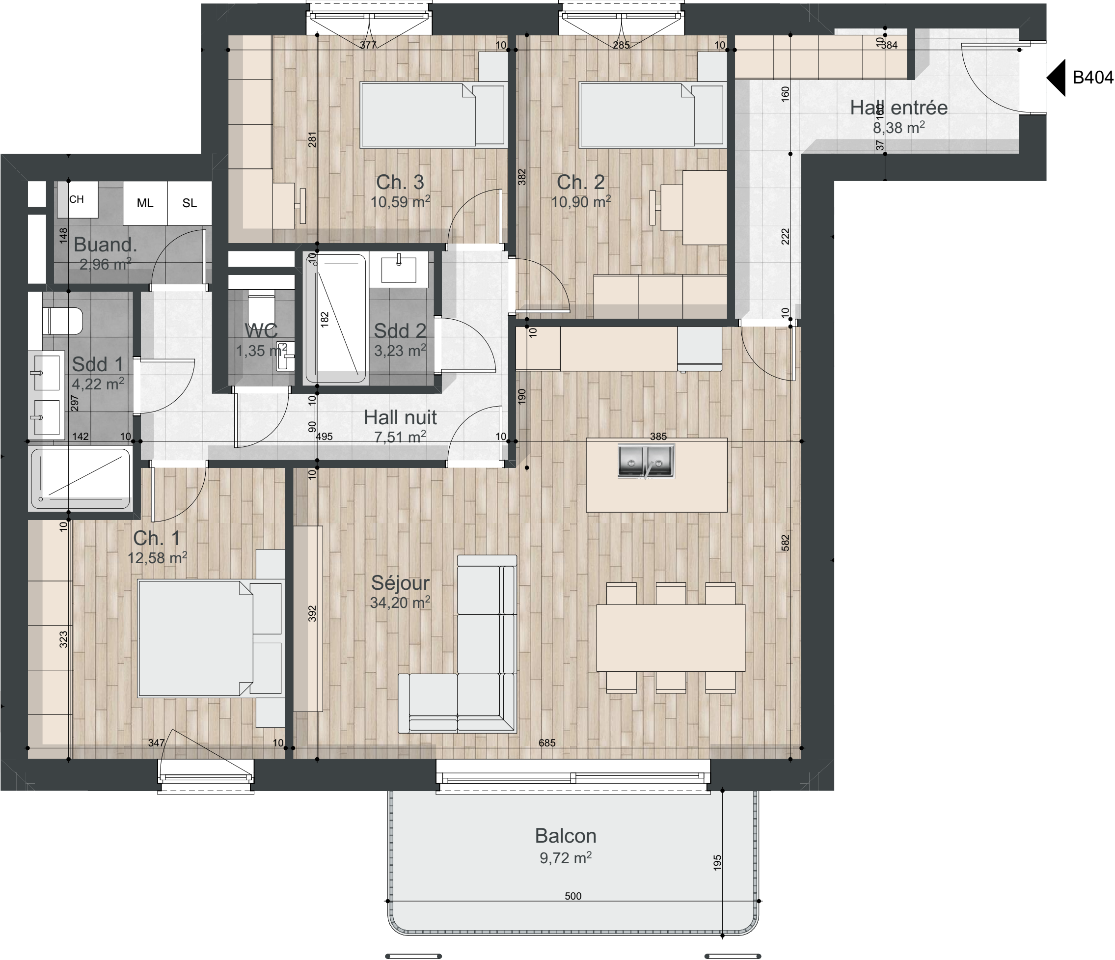
Plan de commercialisation. Les côtes, surfaces et gaines sont susceptibles de modifications dues à des contraintes techniques ou réglementaires. Les meubles et éléments de cuisines dessinés sur ce document ne sont qu'indicatifs. Seuls seront fournis les équipements figurant sur le descriptif annexé au contrat de réservation et/ou à l'acte de vente.