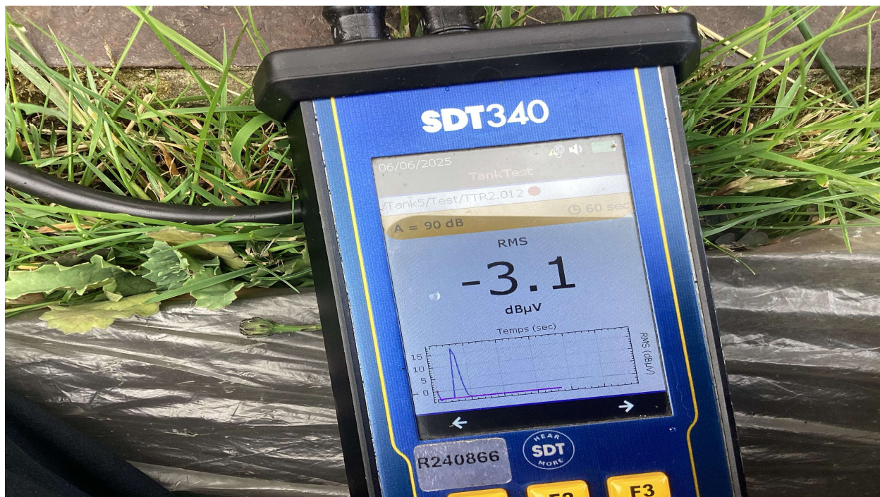
Enregistrement des capteurs avec la fuite calibrée