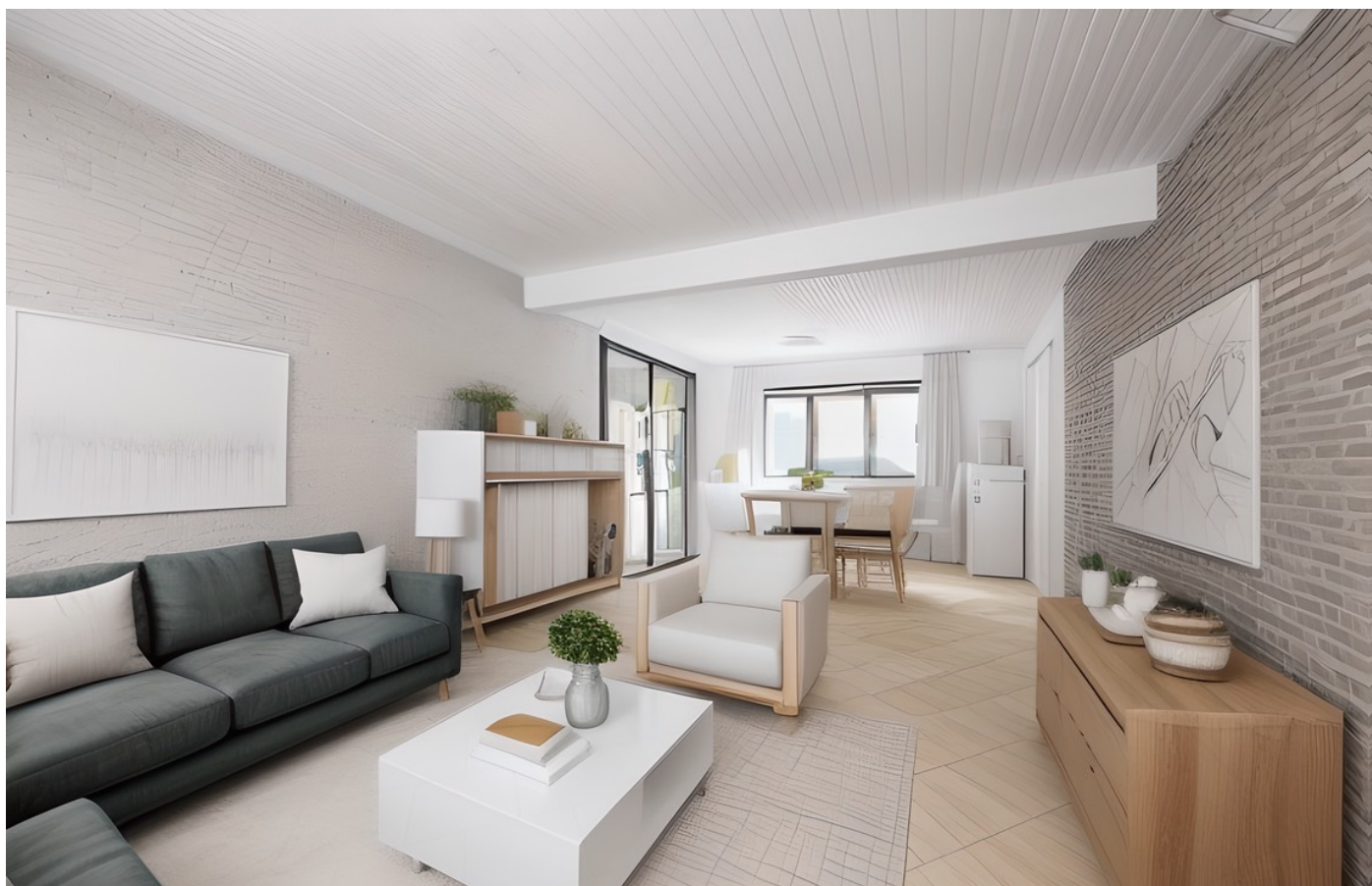
Proposition d'aménagement non-contractuelle